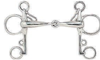
8. Pelham zabla

Minden versenyszámokban csak összekötővel használható!