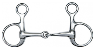
11. Baucher zabla

Stílus versenyszámokban csak összekötővel használható!