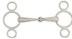
6. Háromkarikás Pessoa zabla

Stílus versenyszámokban csak összekötővel használható!