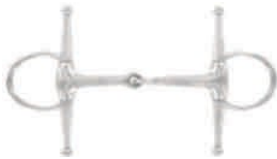
5. Pálcás zabla - egyszer tört