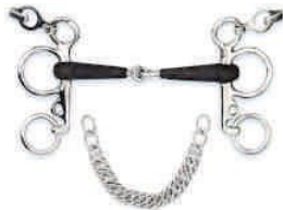
7. Gumis pelham zabla

Stílus versenyszámokban csak összekötővel használható!